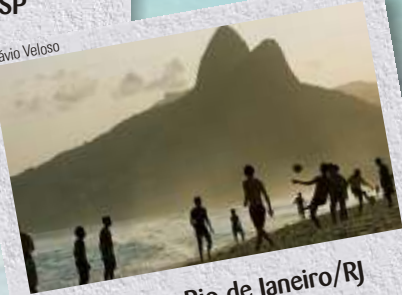
Ipanema, Rio de Janeiro/RJ

A paisagem é estonteante. As areias finas e muito claras contrastam com o mar de águas transparentes, em tons que variam entre o verde e o azul. E a sombra das amendoeiras que margeiam a praia é um refresco para tanto sol. A dificuldade de acesso garante a preservação. Os barcos, proibidos de atracar aqui, ficam na vizinha praia dos Mangues. Fonte: Guia Praias 2010