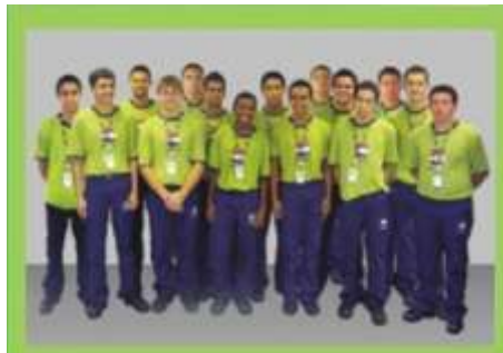
Turma iniciação profissional em Eletromecânica