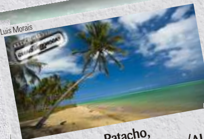
Patacho, São Miguel dos Milagres/AL

A estradinha de terra que leva até a praia é como um preparo, uma promessa. Ela avança pelo meio de um coqueiral até chegar à orla deserta. No mar, os recifes saltam aos olhos. Quase nenhuma construção interfere na paisagem da praia que pertence, na verdade, ao município de Porto de Pedras, vizinho de São Miguel.