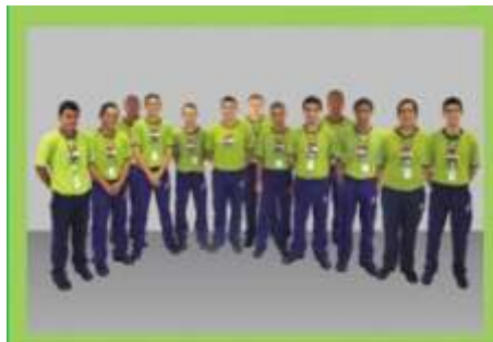
Turma iniciação profissional em Eletricidade