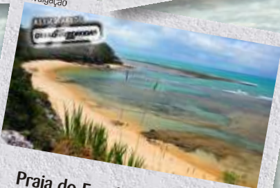
Praia do Espelho, Espelho/BA