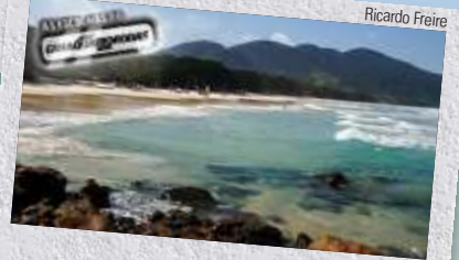
Lopes Mendes, Ilha Grande/RJ