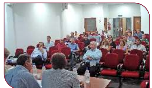
... apresentam resultados de 2009