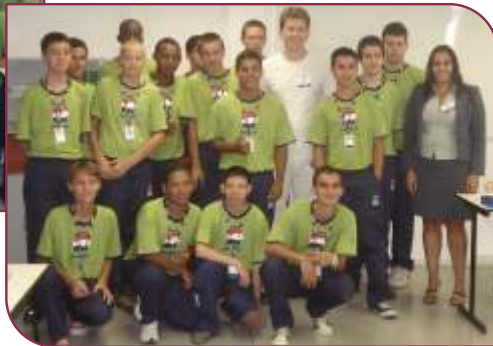
... que ganharam plano odontológico