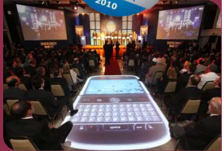
Salão de Eventos do Plaza ficou completamente lotado

A cerimônia foi realizada no Centro de Eventos do Hotel Plaza São Rafael, em Porto Alegre. Nesta 12ª edição do levantamento Marcas de Quem Decide, foram feitas 314 entrevistas com empresários, executivos e profissionais liberais, que indicaram a ordem das cinco principais marcas de 102 diferentes setores.