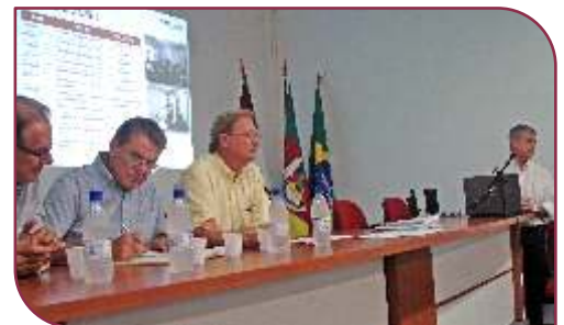
Integrantes do Conselho Executivo...