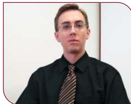
Costa: praticar o cooperativismo demonstra espírito de equipe

Costa explica que ao ser convidado para assumir a Gestão de TI da Uniodonto, percebeu que seria um grande desafio. Assim, a busca de novos conhecimentos em prol da qualificação dos serviços de TI é eminente e, com isso, o crescimento da empresa. Com várias especializações, ele garante que em sua atividade não tem como não estudar sempre, pois tudo muda muito rápido.