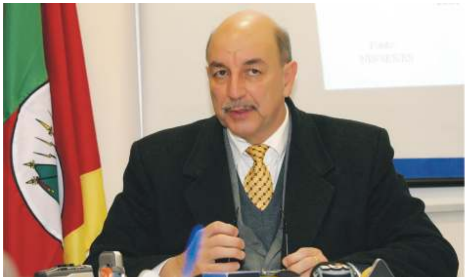
Dr. Terra: os odontologistas podem se vacinar livremente

Dr. Terra - Ainda que os dentistas enfrentem, potencialmente, alguma ameaça da Gripe A, o EPI (luvas, máscara, óculos) serve como "barreira" para o vírus. Além do mais, quem